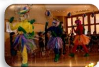
キャンドル ファイヤー