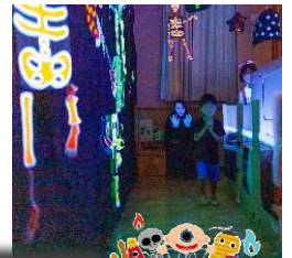
山保名物お化け屋敷