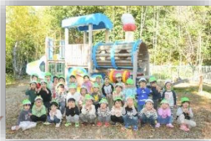
山崎幼稚園アスレチック (3歳児)