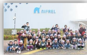
ニフレル・万博記念公園 (5歳児)